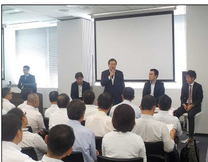
トークセッションの様子

<本資料に関するお問い合わせ先> 株式会社トータルフリートサービス TEL: 03-6311-7864 FAX: 03-6311-8012 URL: http://www.t-fleet-srv.com/ 営業担当 長嶺